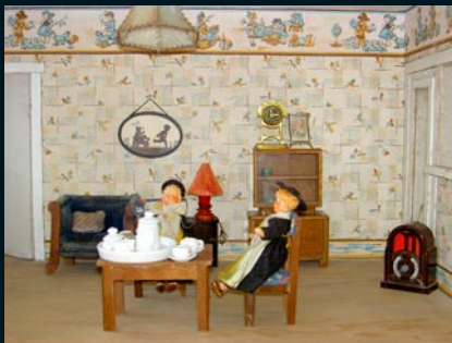
Brúðusafn / the Doll Collection Brúðuhús efr August Hákansson, Reykjavík, 1938, innbú keypt í Kaupmannahöfn sama ár / the doll house was made 1938 and the interior was bought the same year in Copenhagen, Denmark (safneign, owner, the Museum)