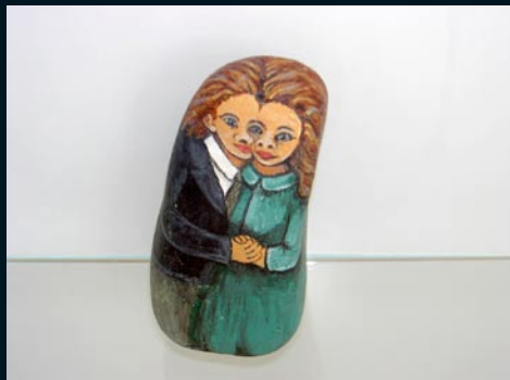
Bergljót Benediksdóttir , Hlégarði, Aðaldal Málaðir steinar / painted stones (safneign / owner, the Museum)