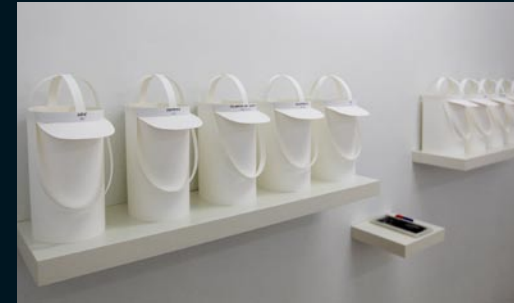
Niels Hafstein , Þinghúsinu á Svalbarðsströnd, 1. maí - 10. júlí Jákvætt-Neikvætt, 2010 / Positive and negative, 2010 Pappírsvrk, texti, segulmagn / paper, text, magnet (eign höfundar / owner, the artist)