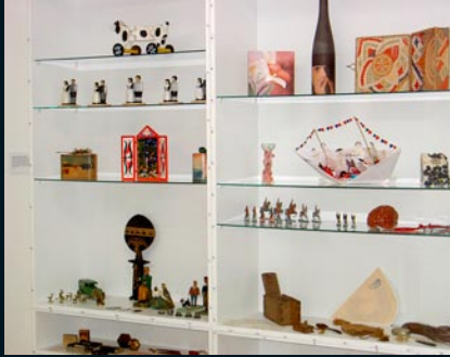
Komdu og skoðaðu í kistuna mína / Cabinets of curiosity Nútímalist, alþýðulist, handverk, kistlar, öskjur, leikföng, kerti, kandis, hár og fræ / modern art, folk art, boxes, tools and toys, together with candles, rock sugar, hair and seed (safneign / owner, the Museum)