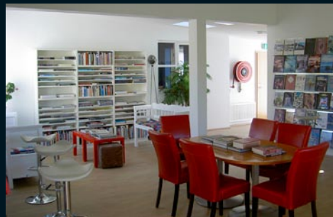
Bókastofa / library