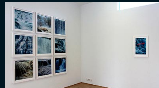
Rúri , Reykjavík Foss 1-9, Endangered Waters, 2003 Ljósmyndir, seria númer 3/3 / photos, serie number 3/3 Gullfoss-II Ófæruselsfoss Dettifoss Dýnjandi Gullfoss-I Gjalfrandi Stóralækjarsfoss Steðji / Tungufoss Bæjarfoss (eign höfundar / owner, the artist) Terminated II, 2007 Gjalfrandi Stafræn prentun / digital print (artist proof) (safneign / owner, the Museum)