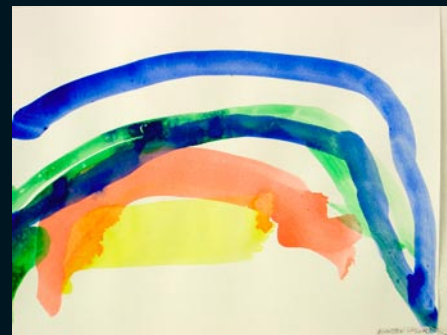
Leikskólinn Álfaborg, Svalbarðseyri / Álfaborg, the local kinder- garten Regnbogar, vatnslitir / rainbows, watercolors (eign barnanna / owners, the children)