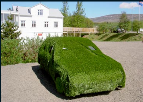
Geðlist, Akureyri Inn og út um gluggann, 2010 / In and out of the window, 2010 Peugeot 306, 1994, gervigras, leikföng / artificial grass and toys (eign Akureyrarbæjar / owner, the City of Akureyri)