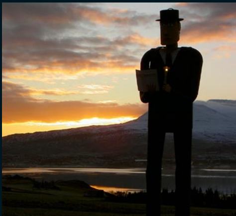
Geðlist, Akureyri Safnvörðurinn, 2009 / the Curator, 2009 Járn, víður, ljós / iron, wood, lantern (eign höfunda / owners, the artists)