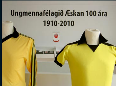
Ungmennafélagið Æskan 100 ÁRA , Svalbarðsströnd / The Youth Association, 1910-2010 Sýning byggð á heimildum og rannsóknargögnum / exhibition of documents and research material (eign Æskunnar / owner, The Youth Association)