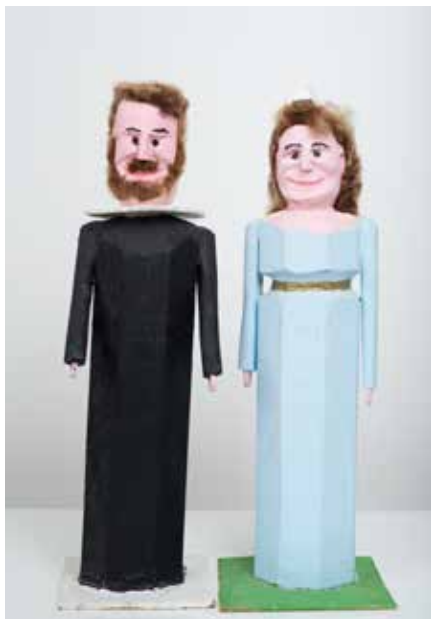
Guðjón R. Sigurðsson (1903–1991)